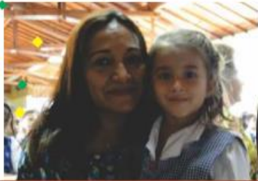
Ganadora segundo premio computador