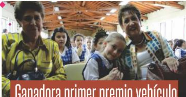
Ganadora primer premio vehículo