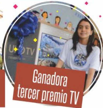
Ganadora tercer premio TV